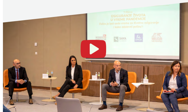
Tribina: Životno osiguranje u vreme pandemije

Više detalja o ponudi kompanije Generali možete pogledati OVDE.